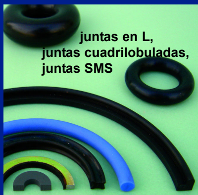
juntas en L, juntas cuadrilobuladas, juntas SMS

Finalmente, la oferta, plebiscitada en este ámbito, es la realización rápida, en menos de