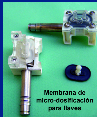
Membrana de micro-dosificación para llaves

10 días, de prototipos en las formas y los materiales más diversos.